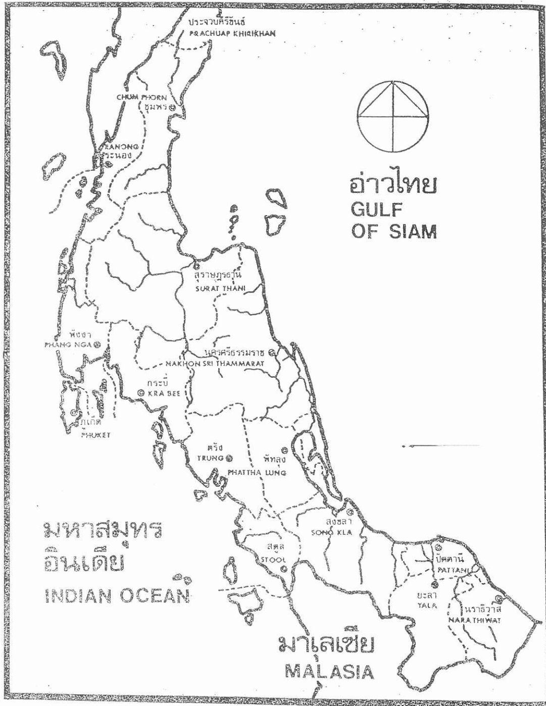
คาบสมุทรภาคใต้ประเทศไทย