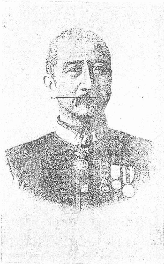
พระยาจรรุราชโกศลกร (คอซิมเต็ก ณ ระนอง)

ระบบเหมามืองสร้างผลประโยชน์ใหญ่ หลวงแก้วผู้ว่าราชการเมือง แต่ประชาชน ระวังกลับต้องสูญเสียผลประโยชน์อย่างมาก ระวังหลังเมื่อเกิดการแข่งขันขึ้นค่า ประมุขภาษี ผู้ว่าราชการเมืองหาทางออกมาขอรื้อเอากับประชาชนผู้เสียภาษี และการ ที่ผู้ว่าราชการเมืองทำกิจการเหมืองแร่ส่วน