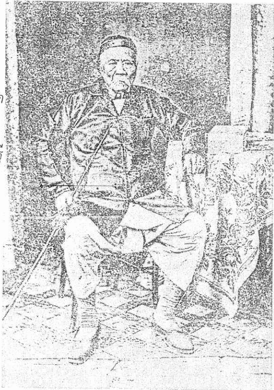
พระรัตนเศรษฐี ณ ระนอง (คอชู้เจียง)

บาทสมเด็จพระจอมเกล้าเจ้าอยู่หัว จากนั้น ระบบเหมมาเมืองก็ขยายออกไปยังหัวเมือง ฝ่ายทะเลตะวันตกอื่น ๆ เช่น ตะกั่วป่า พังงา ภูเก็ต ฯลฯ จนกลายเป็นธรรมเนียมสืบต่อกันมา น่าสังเกตว่า การเริ่มต้นระบบเหมมา เมืองครั้งแรกที่ระนอง จากเจ้าภาษีนายอากร เป็นผู้ว่าราชการเมือง หลังจากนั้นผู้ว่าราชการเมืองจะยื่นขอเป็นเจ้าภาษีนายอากร หรือ