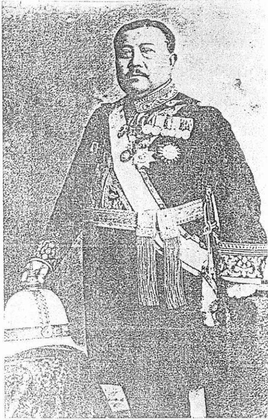
พระยาวิชิตภานุประดิษฐมหิศรภักดี (คอซิมบี๊ ณ ระนอง)

มีผู้ขอเป็นพร้อมกันทั้งสองประการ เพื่อป้องกันข้อขัดแย้งที่อาจเกิดขึ้นในกรณีที่ผู้ว่าราชการเมืองและเจ้าภาษีนายอากรเป็นคนละคนกัน อันจะเป็นเครื่องขัดขวางการรักษาบ้านเมืองให้เรียบร้อย 19 ผลที่เกิดจากระบบเหมาเมืองนี้จะกล่าวต่อไป